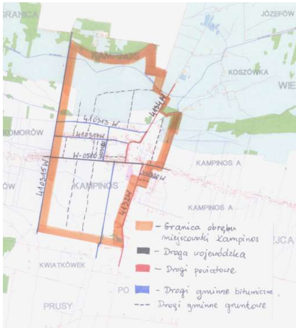
Rys.3. Układ sieci drogowej.

Przez Kampinos przebiegają 2 drogi powiatowe: nr 4132W prowadząca z Kampinosu do Niepokalanowa oraz nr 4134W prowadząca z Kampinosu do miejscowości Górki. Poniżej w tabeli przedstawiono zestawienie dróg przebiegających przez Kampinos. Komunikację z Warszawą prowadzą: PKS Grodzisk Mazowiecki Sp. z o.o. oraz prywatni przewoźnicy.