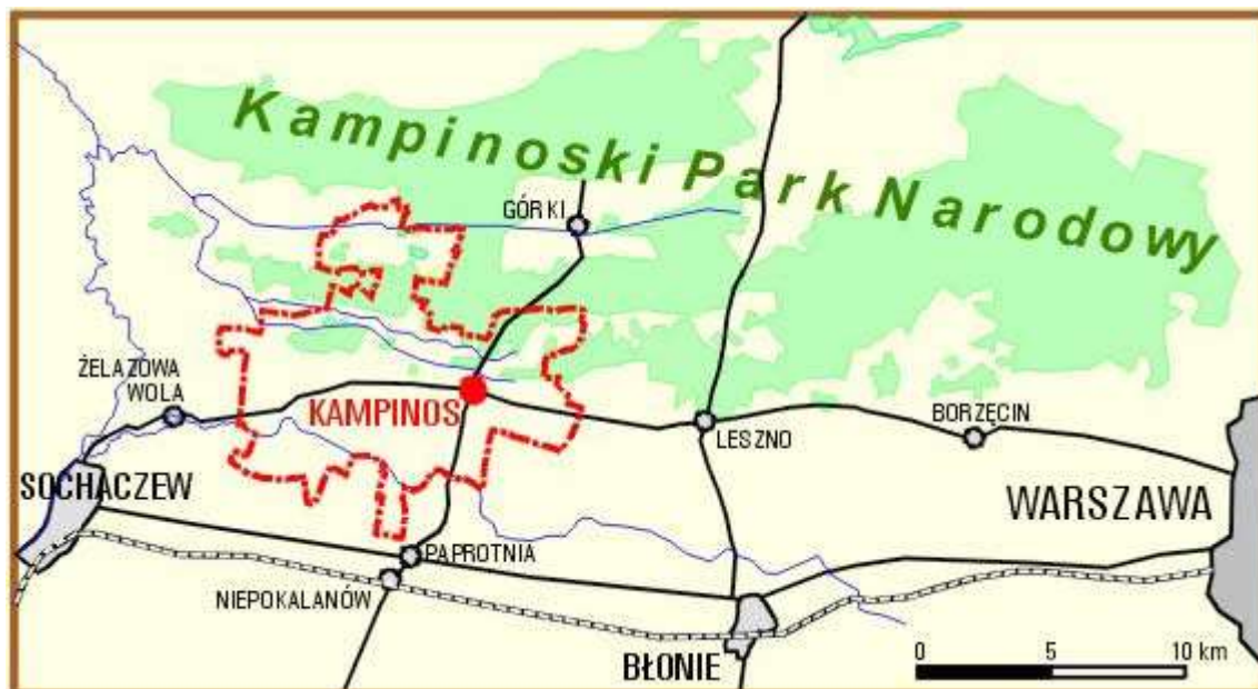
Rys. 2. Położenie geograficzne

Obszar zajmowany przez Kampinos wynosi 506,6 ha, z czego grunty orne stanowią 271,6486 ha. Pod względem powierzchni wieś ta należy do średniej wielkości miejscowości w gminie Kampinos. Struktura wykorzystania gruntów rolniczych w Kampinosie prezentuje się następująco: