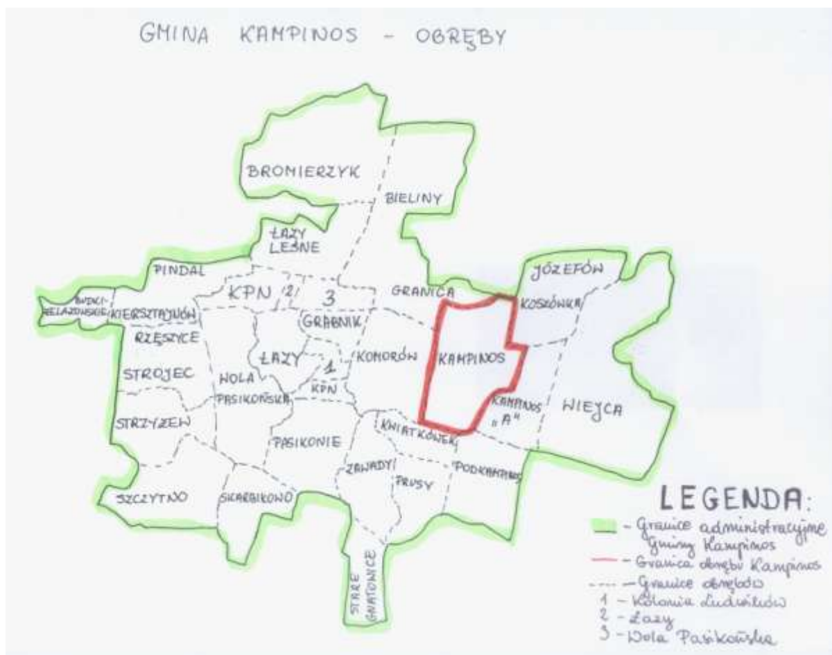
Rys.1. Położenie administracyjne

Miejscowość Kampinos położona jest we wschodniej części Gminy Kampinos. Od wschodu miejscowość ta graniczy z Kampinosem "A", od zachodu z Komorowem. Od północnego zachodu z Granicą, od północnego wschodu z Józefowem. Od południowego zachodu Kampinos graniczy z Kwiatkówkiem, a od południowego wschodu z wsią Podkampinos.