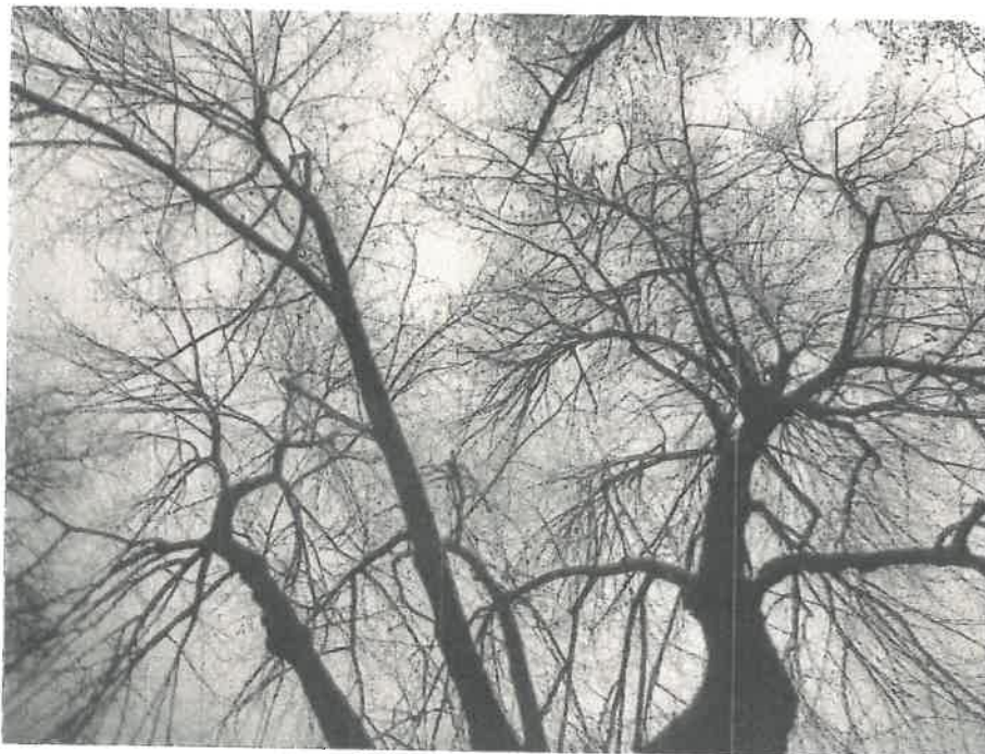
Ryc. 11 Drzewo nr 4 – korona