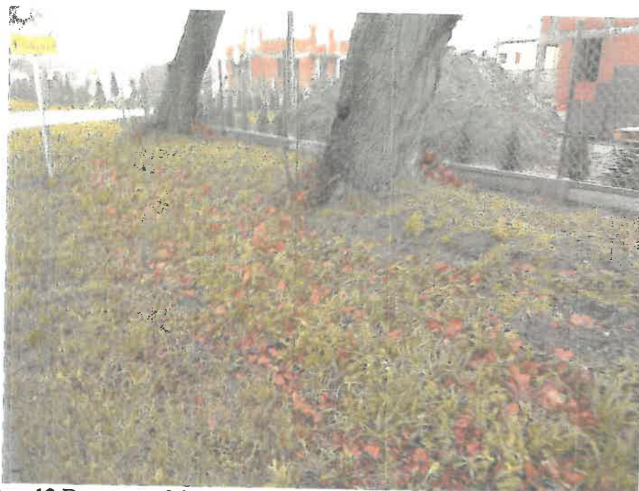
Ryc. 12 Drzewo nr 3 i 4 – warunki rozwoju systemu korzeniowego drzew