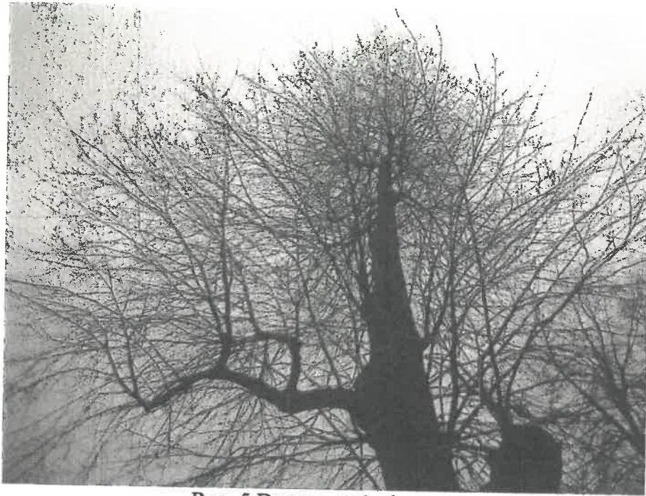
Ryc. 5 Drzewo nr 1 - korona