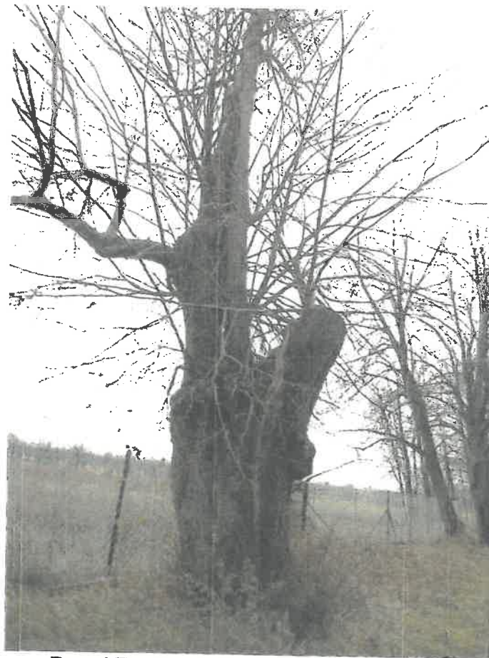
Ryc. 4 Drzewo nr 1 – pień i nasada korony