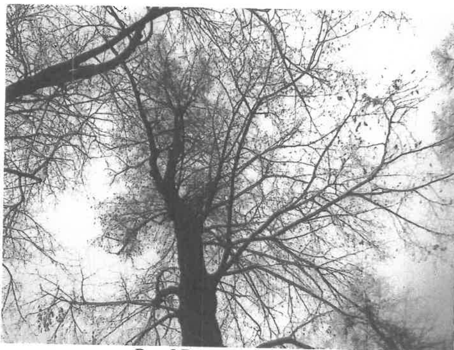
Ryc. 8 Drzewo nr 3 - korona