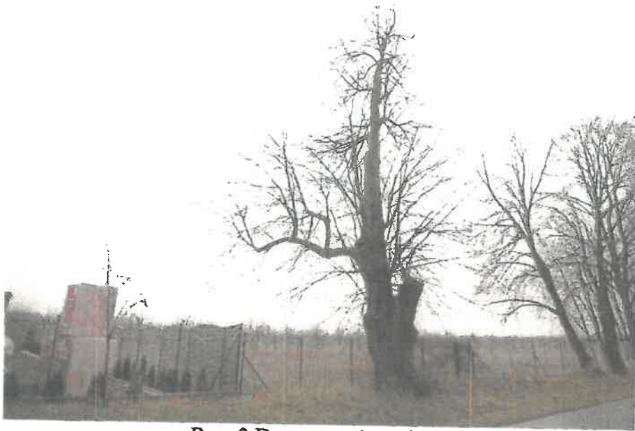
Ryc. 3 Drzewo nr 1 - pokrój