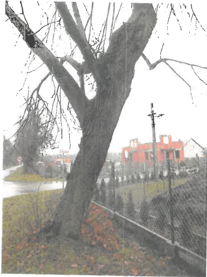
Ryc. 9 Drzewo nr 4 – pień