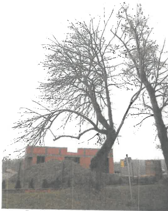
Ryc. 10 Drzewo nr 4 – pokrój drzewa