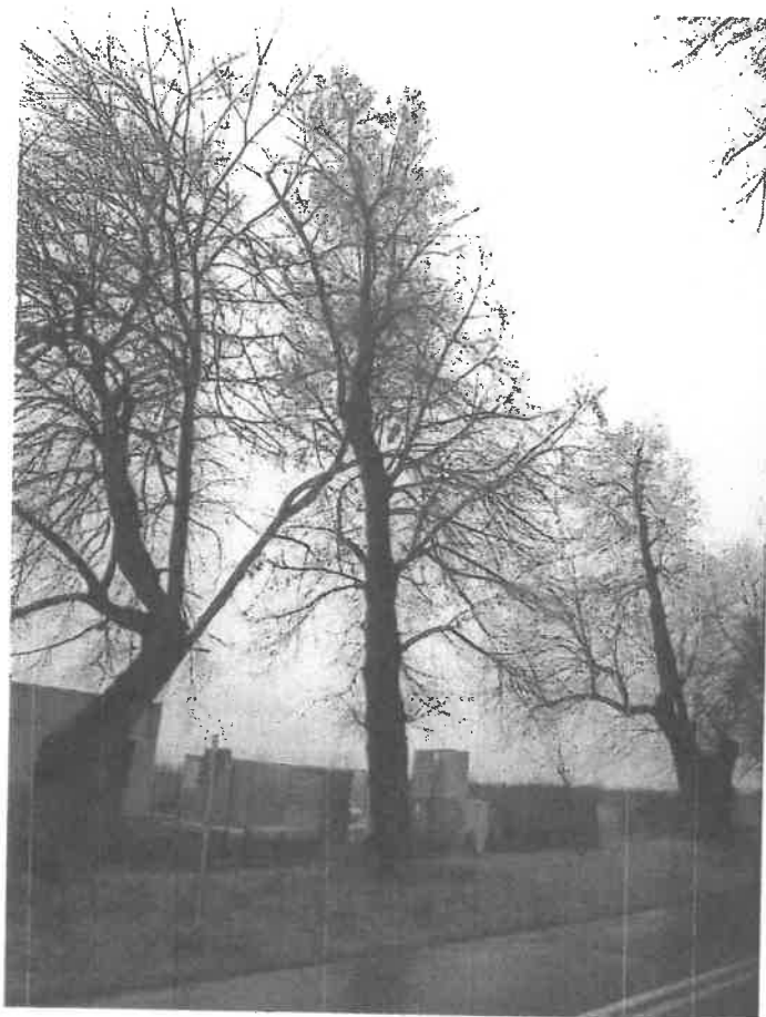
Ryc. 7 Drzewo nr 3 - pokrój