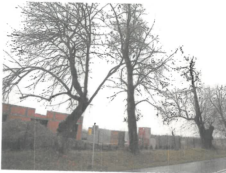
Ryc. 1 Drzewo w alei zabytkowej w zakresie opracowania