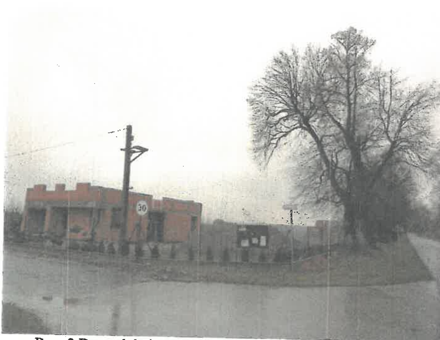
Ryc. 2 Droga lokalna w sąsiedztwie opracowywanej działki